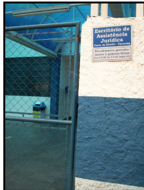
Visão da entrada do Prédio onde está instalado o EAJUR