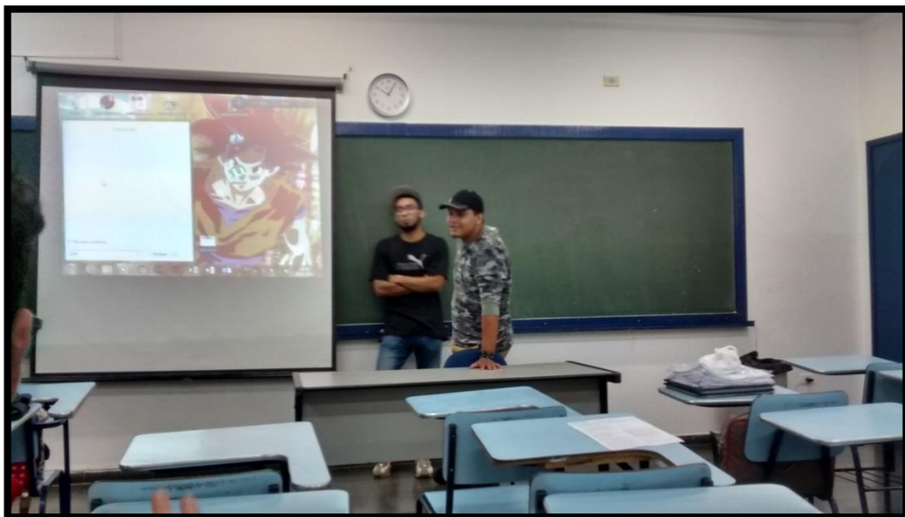
A Geografia, a Música e a Matemática, parceiras no processo de Ensino e Aprendizagem