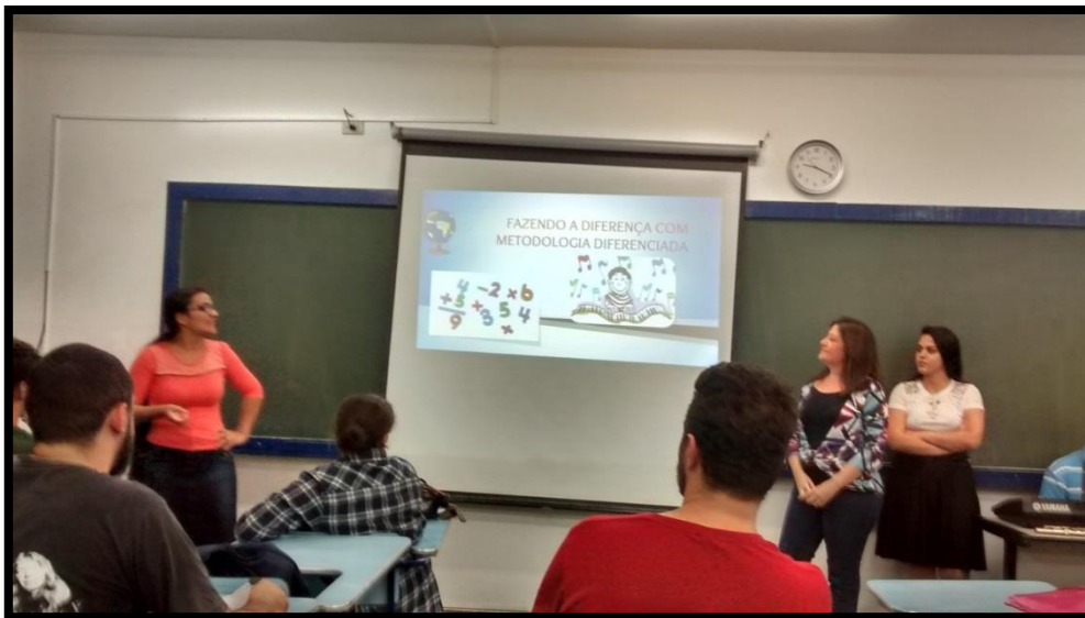
A Música e a Matemática juntas no processo Ensino aprendizagem