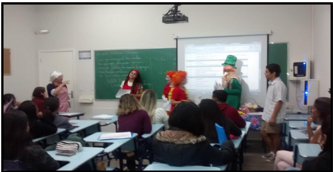
Dramatização do sítio do Pica – Pau- Amarelo. Estudo da sintaxe na obra “O poço do Visconde”.