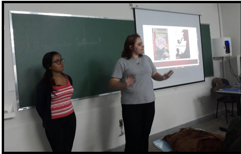
Jogo de "Detetive" -Sherlock Holmes e a Sintaxe