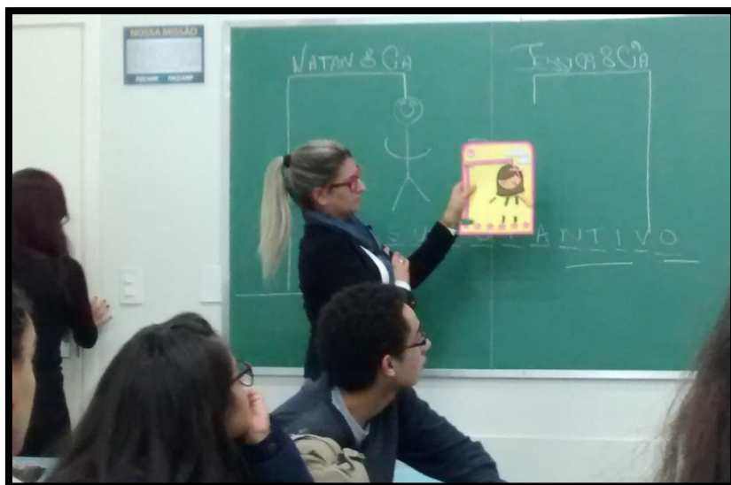
Brincando de "Desenforçar" com a sintaxe