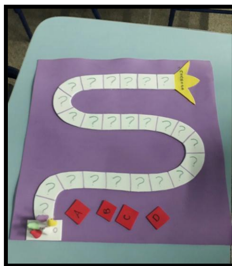
Aprendendo sintaxe no tabuleiro