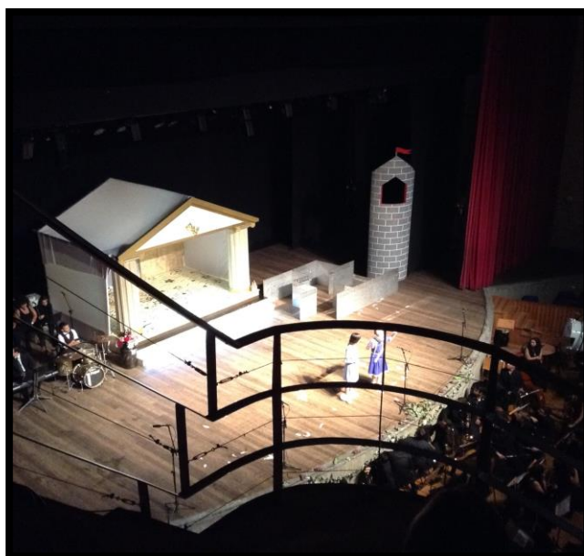
isão parcial do palco da peça Voando com Ícaro- à direita, alunos de música da Faccamp

Da criança ao idoso, do estudante ao curioso, "Voando com Ícaro" transportou a plateia para os mais altos lugares, todos abastecidos pelo combustível do amor.